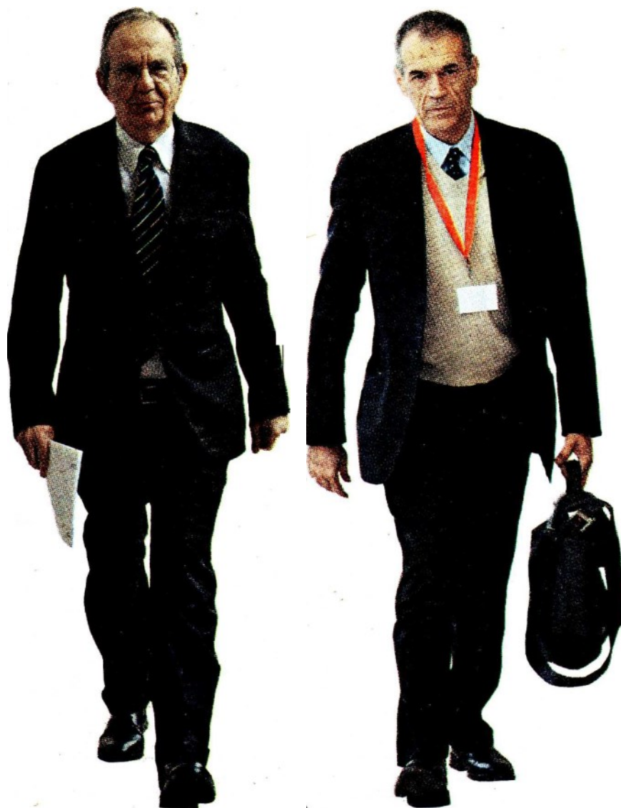
A sinistra, il ministro dell'Economia Pier Carlo Padoan A destra, l'economista Carlo Cottarelli