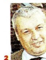
Gli ex direttori generali e poi ministri del Tesoro, Vittorio Grilli (1) e Domenico Siniscalco (2)